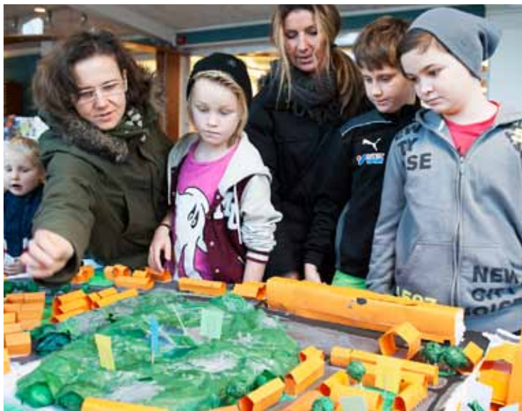
Femteklassare på Gamlestadsskolan hade byggt en miniatyrmmodell för att visualisera byggnader och inspirera till en bättre dialog.