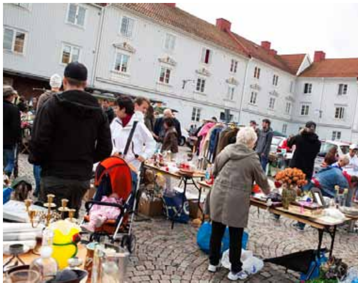
De senaste årens succé Gamlestadsgalej kommer tillbaka i augusti.

medlemmar och Kvickroten runt femtio. Det finns gemensamma odlingar som är öppna för alla med fruktträd, vin- och krusbärsbuskar, en kryddträdgård och mycket annat. Men vill man ha en egen lott får man stå i kö, då utrymmet idag är begränsat. Aktiviteten är stor och även de som inte odlar är gärna där och