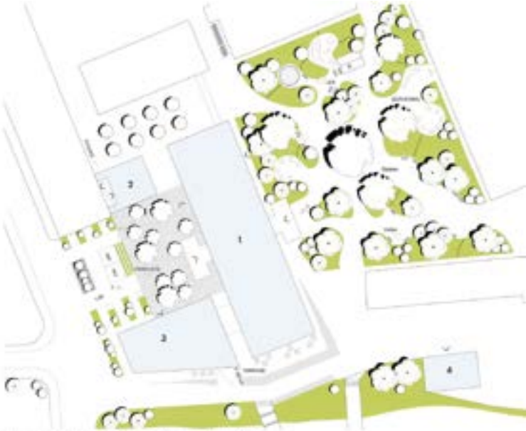
Wingårdhs | SBB | Förstudie Detaljplan vid Hornsgatan inom stadsdelen Gamlestan | 2021.02.11 | Skala 1:800 (A3)