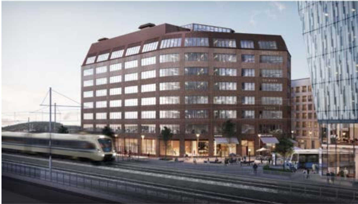
GAMLESTADEN 80:2 KVARTER A GESTALTNINGSBILAGA 2021.02.05